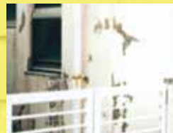
壁が剥がれている