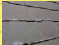
色落ち・基材の劣化